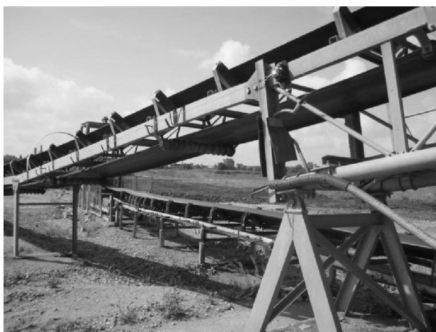
Pohled na poškozený pásový dopravník

1. Pachatel v pískovně Roztyly z pásového dopravníku odcizil 105 m kabelu, při odcizení poškodil instalaci reflektorů a chráničky, čímž způsobil firmě celkovou škodu za téměř 60 tis. Kč. (tr. čin).